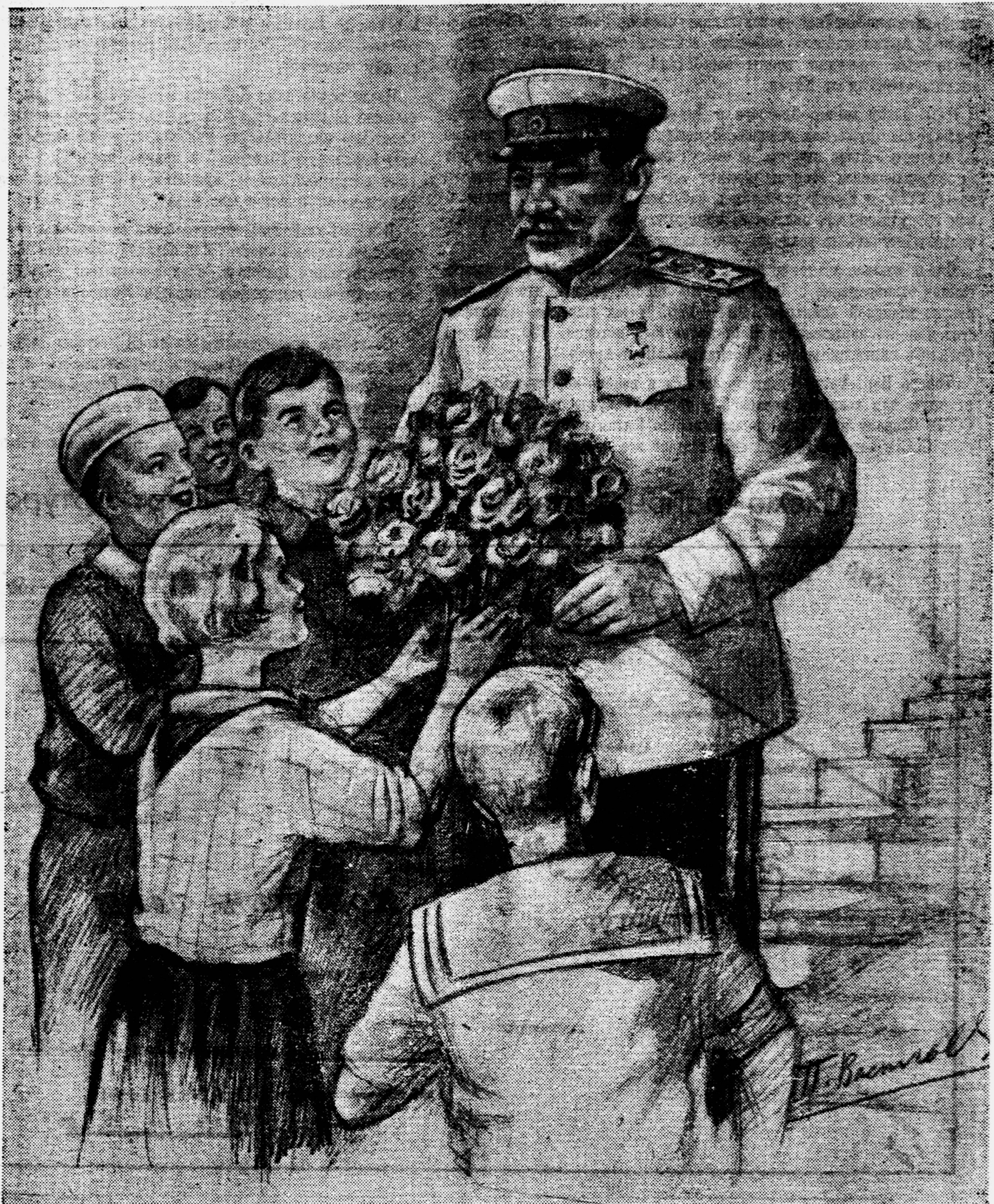
Рисунок П. ВАСИЛЬЕВА.

О нашей школе над рекой, О классе в два окна. На свете не было такой Хорошей, как она!