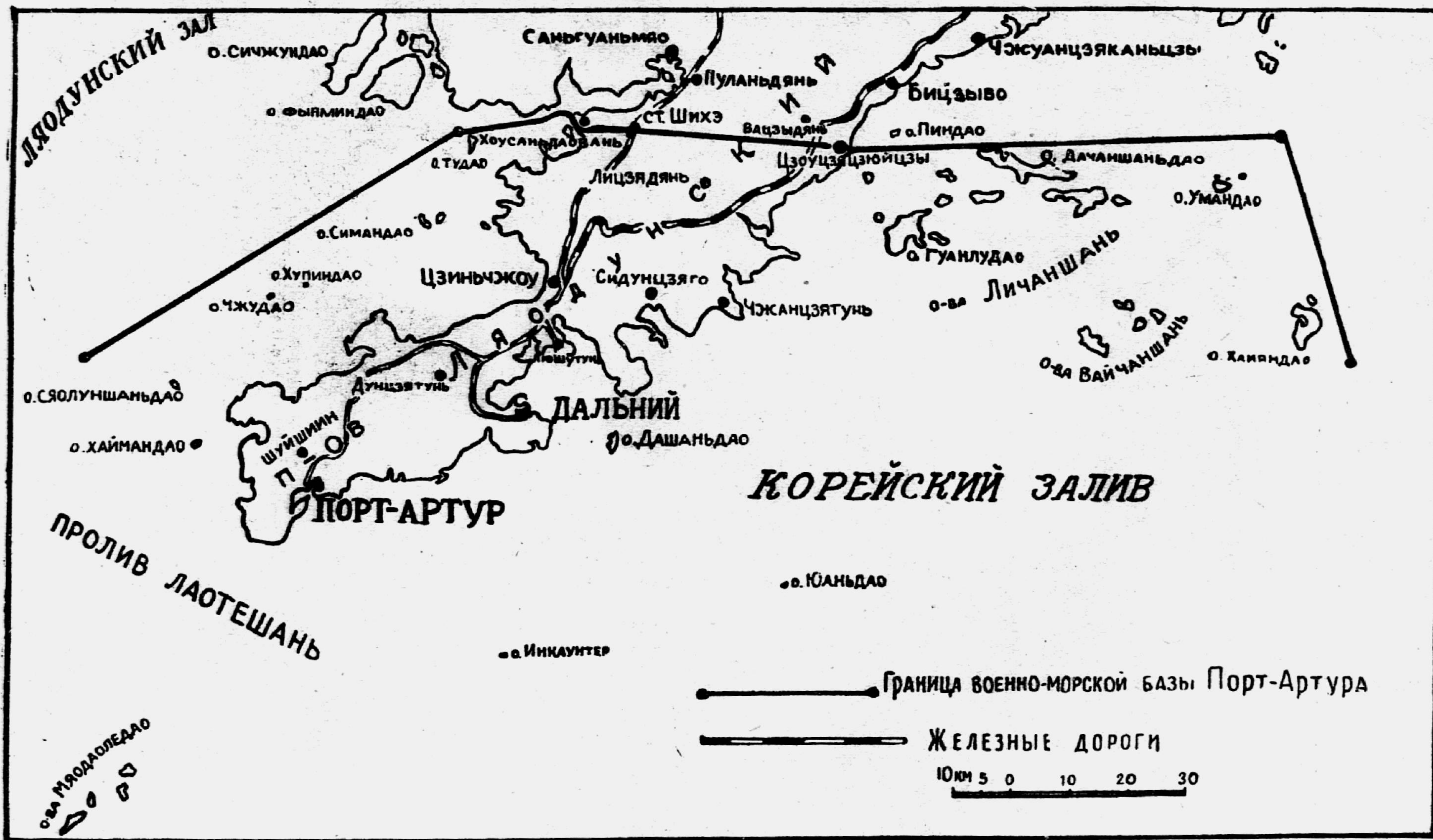
Схема района военно-морской базы Порт-Артура