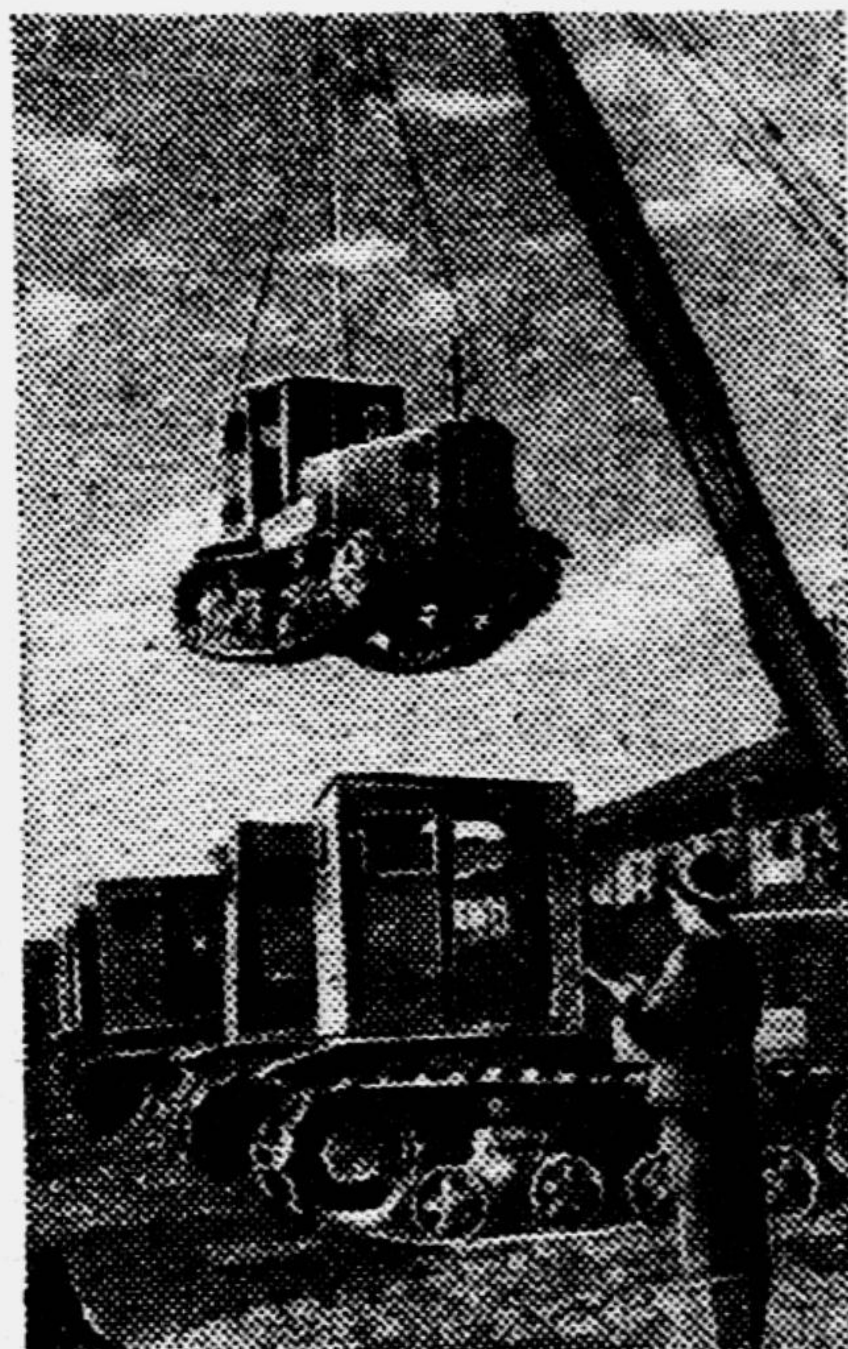
Отправка тракторов «АТЗ» в освобождённые области и районы.